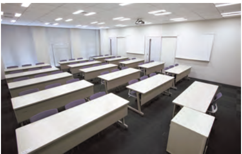
様々な用途に利用できる会議室